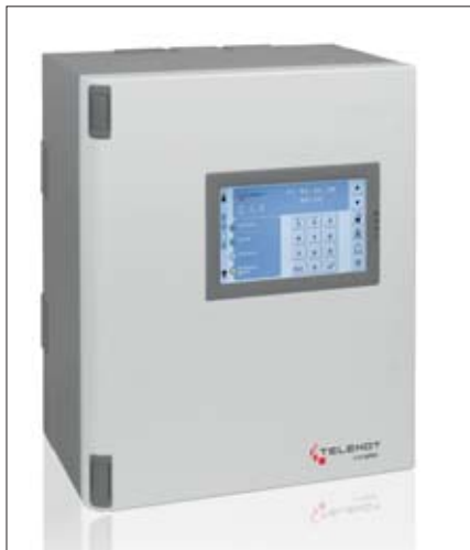
Bild 2: Die Gefahrmelderzentrale »complex 400H« ist das Herz der Sicherheitslösung bei Alzner Automotive: Dank ihres modularen Aufbaus bieten sich ausreichend Ressourcen, falls sich das Unternehmen weiter vergrößert