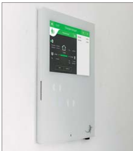
Bild 3: Die komplette Gebäudeautomation lässt sich einfach über den Displaycontroller »myGekko Slide2« steuern, der die Visualisierung und Bedienung der verschiedenen Gebäudefunktionen ermöglicht

in Grafenau alle KNX-Produkte problemlos integrieren und kostspielige Neuanschaffungen waren nicht notwendig.