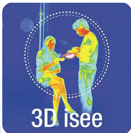
Bild 5: Mit einem 3D isee-Sensor ausgerüstete Klimageräte »sehen den Raum« wie eine Wärmebildkamera und können so auf Bewegungen der Personen im Raum hin den Luftstrom entsprechend lenken

Planung sowie Auslegung. Darüber hinaus sind viele Klimageräte mittlerweile in der Lage, den Luftstrom zielgerichtet und differenziert in den Raum zu führen.