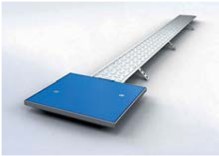
Bild 12: Bodenbündige und kabellose (induktive) Ladeinfrastruktur zum Überfahren

brantentechnik für absolute Betondichte, Zugentlastung und verhindert ein zu weites Einschieben.