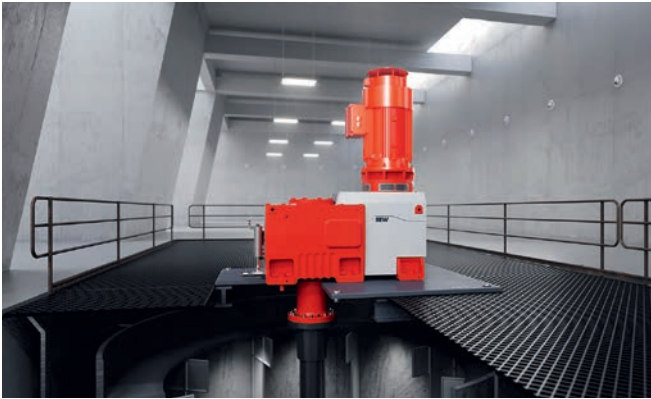
Bild 6: Mit der Rührwerksausführung der Baureihe »X.e« erweitert SEW-Eurodrive sein Produktportfolio im Bereich der anwendungsspezifischen Applikationsgetriebe

Powerschnittstelle für die Sensor/Aktor-Verteiler. Der Wechsel vom alten Standard hin zu M12 L ermöglicht in der Größe um mehr als 50 % reduzierte Boxen.