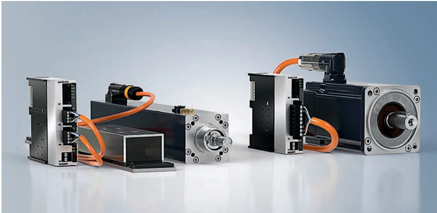
Bild 3: Beckhoff Automation erweiterte seine kompakte Antriebstechnik um translatorische Servomotoren

Sicherheitsfunktion STO/SS1 und »Twinsafe Logic«.