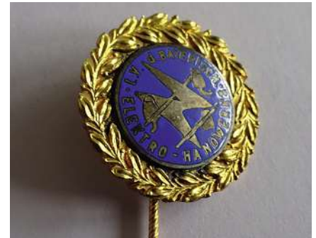
Bild 3: Ehrennadel des Bayerischen Landesverbands aus den 1920er Jahren

Einer der wesentlichen Themen des bayerischen Landesverbands ist weiterhin der Kampf für den freien Wettbewerb und gegen Monopolbestrebungen der Elektrizitätswerke. Bereits 1927 kann der Landesverband bayernweit einheitliche Meisterprüfungen für Elektrohandwerker durchsetzen. Bei einer Mitgliedsversammlung des Bayerischen Landesverbands im Jahr 1927 bemerkt Georg Montanus , der Gründer und langjährige Vorsitzende des Bundesverbands VEI, zur Arbeit des Landesverbands, »daß Ihr Landesverband am besten arbeitet von unseren 17 Bezirksverbänden.«