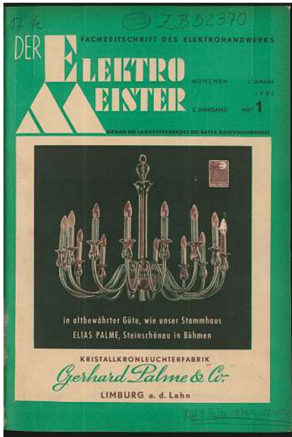
Bild 4: Von 1948 bis 1971 ist der »Elektromeister« das offizielle Organ des Bayerischen Landesinnungsverbands

gend mit Instandhaltung zerstörter Elektroanlagen beschäftigt. Im Juni 1944 wird die Geschäftsstelle des Bezirksverbandes völlig ausgebombt.