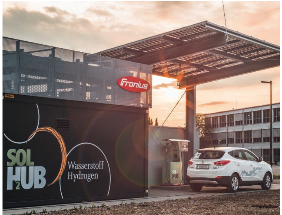
Bild 4: Der Solh2ub bietet eine nachhaltige Mobilitäts- und Energielösung für Gewerbe und Kommunen

Mit dem HPS System Picea ist ein für Einfamilienhäuser entwickeltes Energiespeichersystem (Bild 2) verfügbar, das mit einer PV-Anlage auf dem Dach Solarstrom erzeugt,