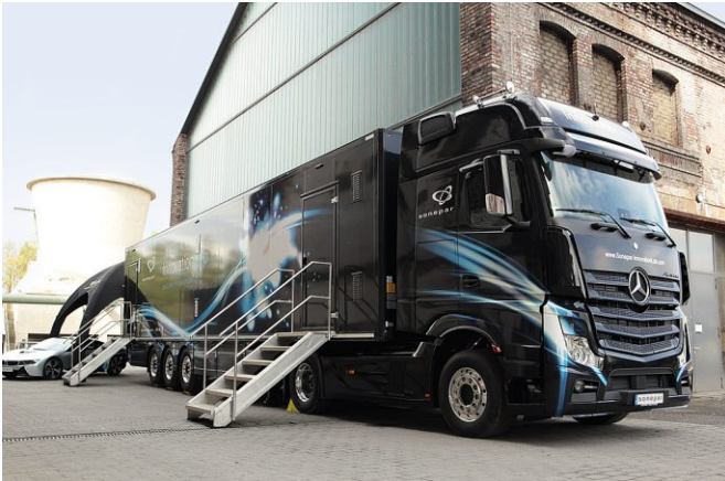
Bild 14: Das Innovation Lab des Elektrofachgroßhandels Sonepar ist ein beeindruckendes Beispiel für gelungene Vorvermarktung