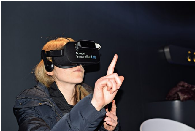
Bild 15: Die neue Präsentation im Innovation Lab widmet sich dem Smart Home und begeistert auf Anhieb seine Besucher