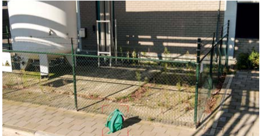
Bild 4: KI-gestützte Kameras erkennen in zurückgelassenem Gepäck ein mögliches Sicherheitsrisiko

längeren Zeitraum unerlaubt vor Gebäuden oder in abgegrenzten Bereichen aufhalten. Da ein solches Verhalten mitunter zu Diebstählen und anderen unerwünschten Ereignissen führen kann, unterstützt die KI-Videoanalyse das Sicherheitspersonal vor Ort bei seiner Aufgabe, für die Sicherheit von Menschen und Eigentum zu sorgen.