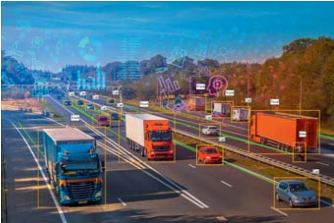
Bild 2: Aus von Kameras erfassten Verkehrsdaten können Analysen erstellt werden, um Staus zu vermeiden