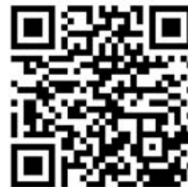
Bild 2: Der QR-Code führt direkt zur Umfrage »Motivation der Mitarbeiter«

Geben Sie den QR-Code in Bild 2 an Ihre Beschäftigten weiter, damit wir möglichst viele Meinungen von Mitarbeitern des Elek-